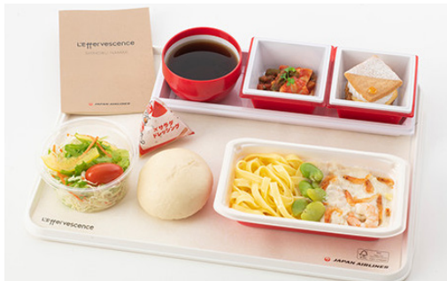
グラフィックデザイン ハワイ便 / ほか国際便 機内食デザイン 日本航空株式会社