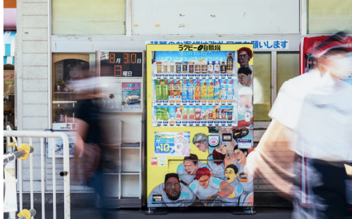
コンテンツ開発 ラグビー自販機 サントリービバレッジソリューション株式会社