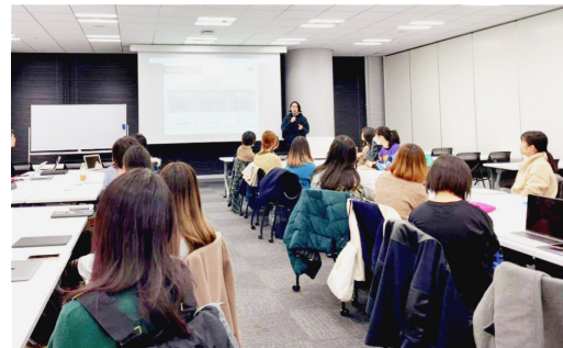
美大生イベント企画 ポートフォリオ講座 株式会社サイバーエージェント